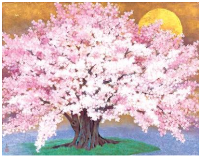
「活きる」日本画 南 正文 (大阪府)